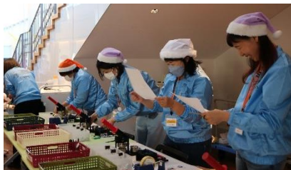
2023年11月3日(金祝) 「やまとみらいまつり」 イベントサポート、広報サポートを実施。

地域のイベント、「やまとみらい」主催のイベントを中心に、やまとみらいスタッフと一緒に活動していただきました。二次元コードにアクセスいただくと、活動のレポートを読むことができます。