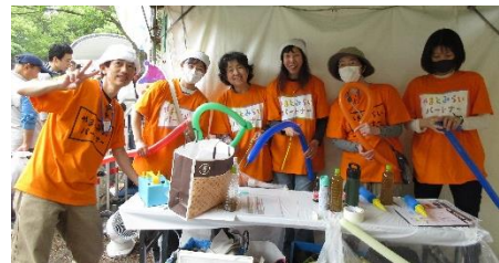
2024年5月11日(土)・12日(日) 「大和市民まつり」 テント内でバルーンアートを実施。